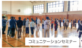
コミュニケーションセミナー

同じ悩みを持つ者同士の 本気の語り合いが、安全 な世界を築く、素敵なセ ミナーです。セミナーに参加 してから、少しでも人を信じら れるようになるはずです。