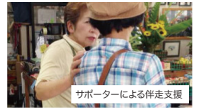
サポーターによる伴走支援