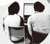
好きなことや雑談